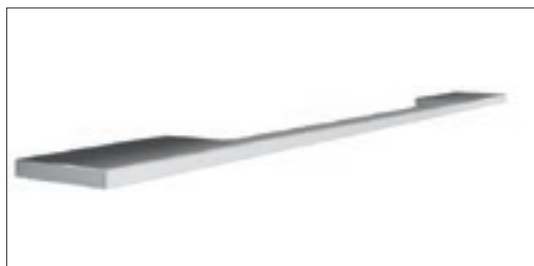
Linea cromata | Chrome-finish Linea

external handle (modular pitch 64 - 160 - 320 mm)