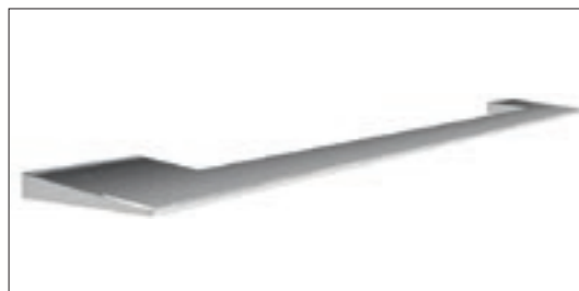
Zoe cromata | Chrome-finish Zoe