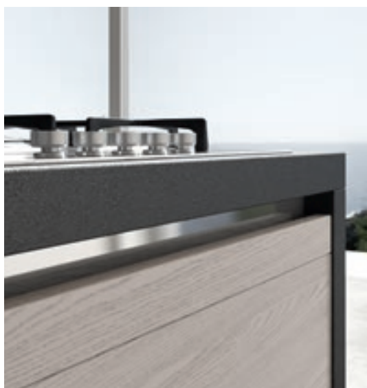
Alluminio finitura lucida | Shiny aluminium finish