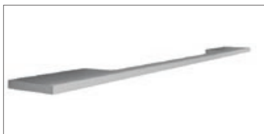
Riga satinata | Satin-finish Riga