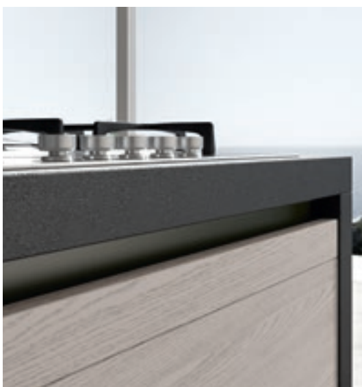
Laccato finitura lucida o opaca | Gloss or matt lacquered finish