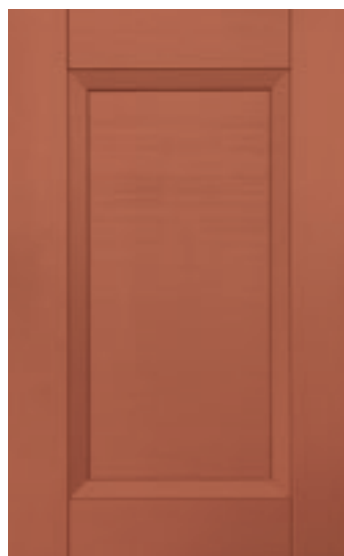
Rosso Mattone 131M | Brick red 131M