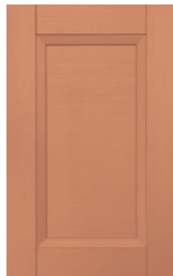
Pesca 138M | Peach 138M