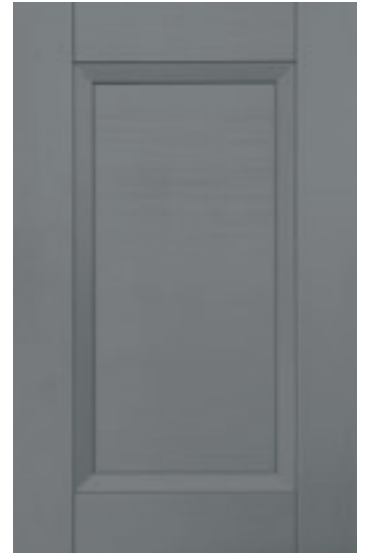
Grigio 127M | Grey 127M