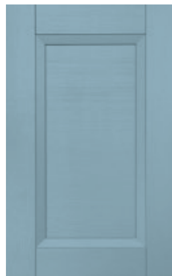
Ceruleo 125M | Cerulean 125M