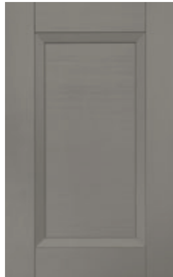
Fango 703M | Mud 703M