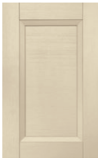
Avorio 107M | Ivory 107M