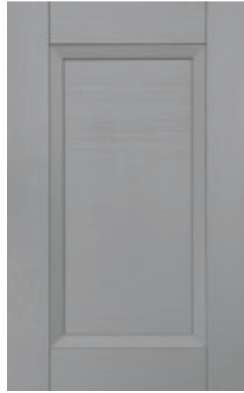
Cenere 139M | Ash 139M