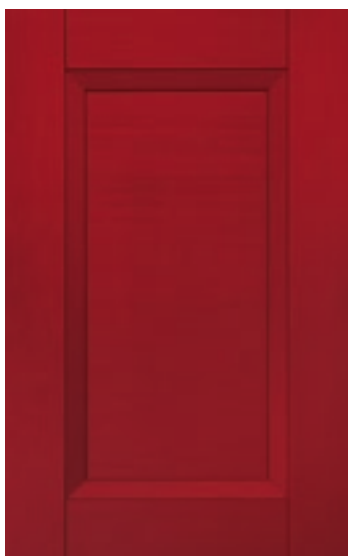
Rosso 102M | Red 102M