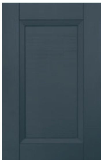
Blu notte 135M | Midnight blue 135M