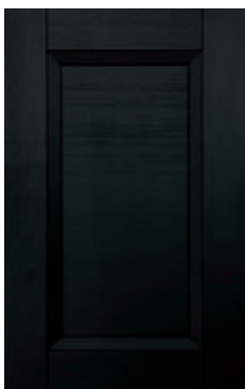
Nero 114M | Black 114M