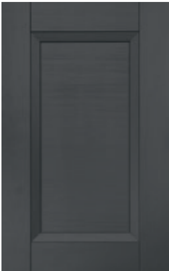
Antracite 117M | Anthracite 117M