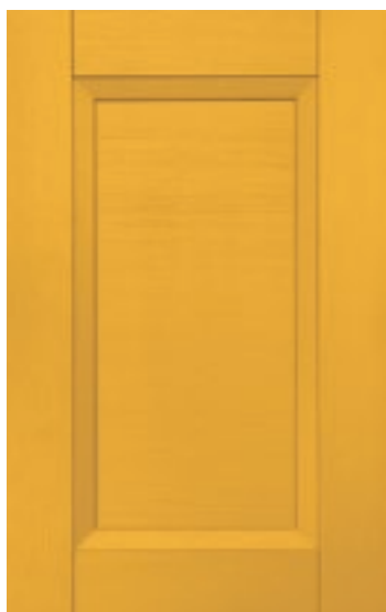
Giallo ocra 144M | Ochre 144M