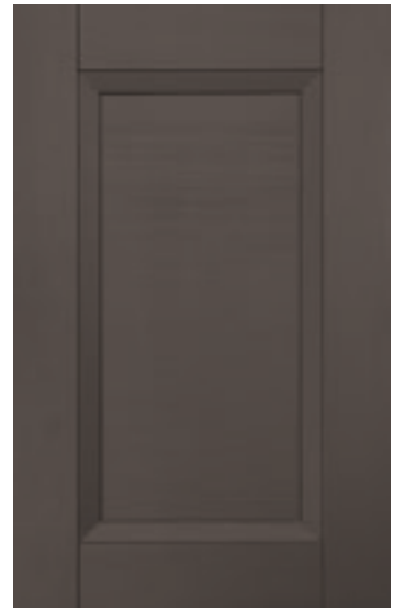
Tortora 104M | Taupe 104M