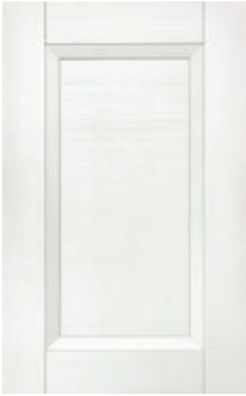
Bianco 101M | White 101M