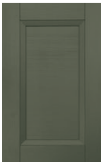
Verde militare 146M | Military green 146M