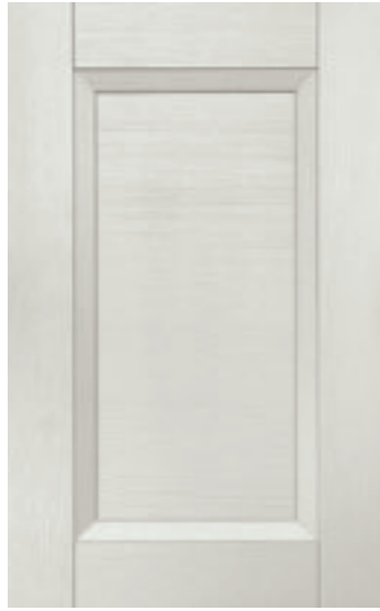
Ghiaccio 126M | Ice 126M