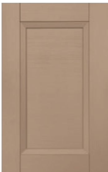
Crema 133M | Cream 133M