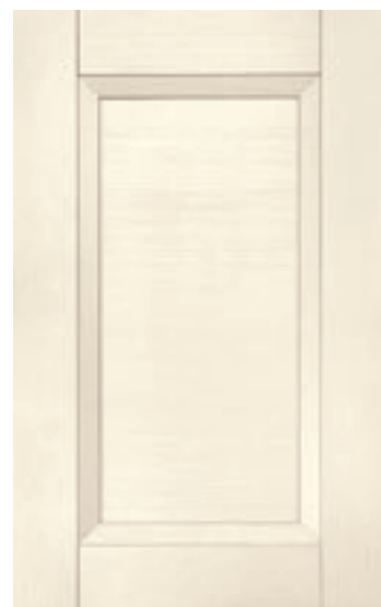
Magnolia 217M | Magnolia 217M