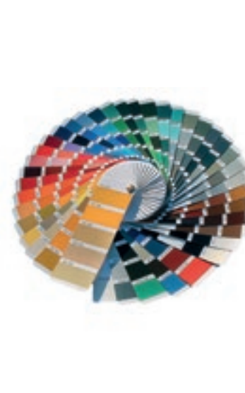
Scala RAL / NCS