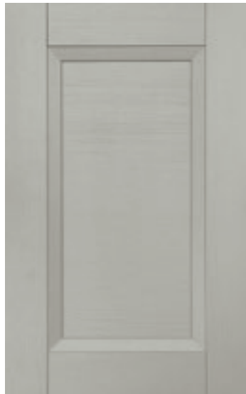
Cemento 129M | Cement 129M