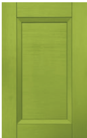
Verde felce 145M | Moss green 145M