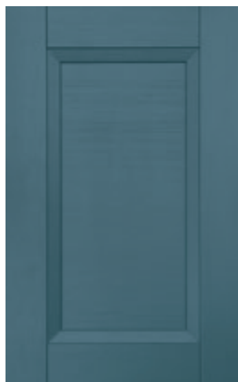
Blu jeans 143M | Denim 143M